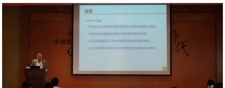
分论坛四会议现场

此次活动在中世联盟和天衡律所的联合举办以及众嘉宾的热情参与下圆满落幕。与会人员纷纷表示，参加此活动获益匪浅，深刻意识到律所间合作的重要性并希望将无边界合作付诸实践。天衡自加入中世联盟后，积极参与联盟的各项活动，同时也不断践行联盟的合作理念。天衡将在未来仍将秉承无边界合作的理念，立足本地，服务海西，辐射全国，团结联合各兄弟律师事务所，为客户提供跨区域、跨领域的全面的法律服务，为客户提供更优质、安心的服务体验。