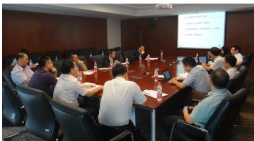
分论坛二会议现场