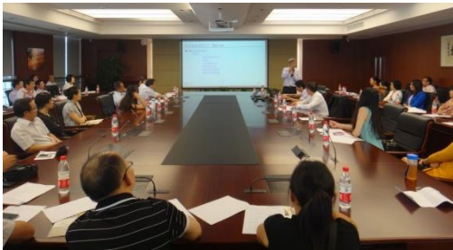
分论坛一会议现场